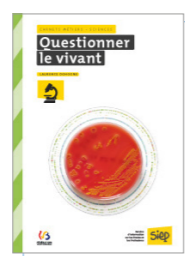
Questionner le vivant