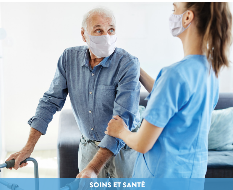
SOINS ET SANTÉ