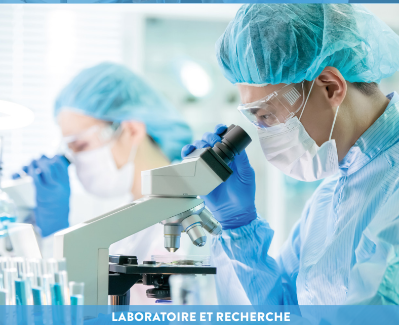
LABORATOIRE ET RECHERCHE