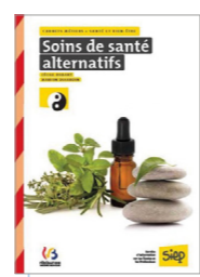
Soins de santé alternatifs