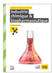
Industrie chimique et biopharmaceutique